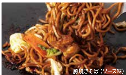
豚焼きそば(ソース味)