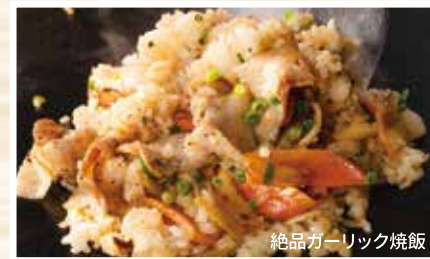
絶品ガーリック焼飯