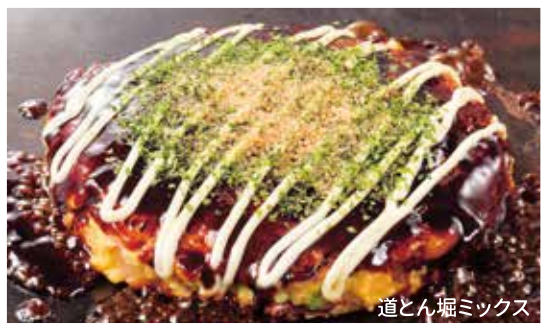
道とん堀ミックス