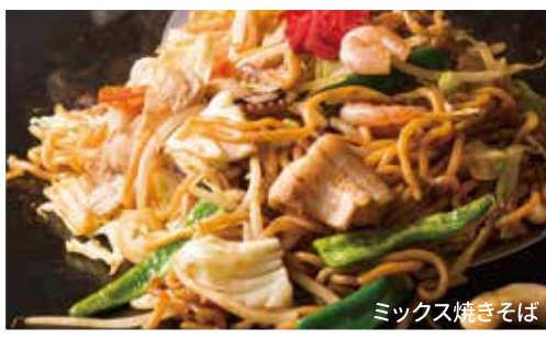
ミックス焼きそば