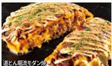
道とん堀流モダン焼き