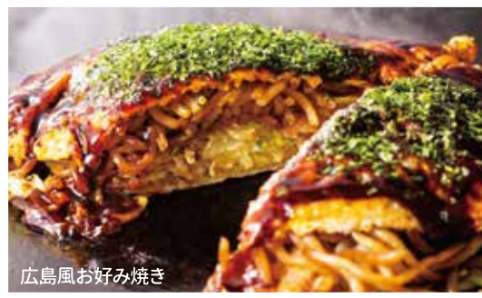
広島風お好み焼き